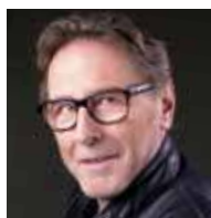
Prim. Univ.-Doz. Dr. Christian Geretsegger Universitätsklinik für Psychiatrie und Psychotherapie, Salzburg

Strukturelle und funktionelle bildgebende Untersuchungsmethoden haben viel zum Verständnis der Symptomatik beigetragen: neben diffusem Verlust an grauer Substanz und erweiterter Ventrikel zeigen sich fokale Störungen in den Bahnen der weißen Substanz als Hinweise für veränderte anatomische und gestörte funktionelle Konnektivität. Degenerative (auto-)immunologische Prozesse sind wahrscheinlich an diesen strukturellen Veränderungen beteiligt. Elektrophysiologische Befunde weisen dabei auf Störungen der Informationsverarbeitung hin, einerseits aufgrund abgeschwächter neuronaler Aktivierung durch neue Stimuli (Bramon et al. 2005), andererseits durch verminderte Fähigkeit, die Aktivierung durch repetitive Stimuli zu begrenzen (Patterson et al. 2008). Diese Befunde weisen auf die Bedeutung von Wahrnehmungsstörungen für die Entwicklung der psychotischen Symptomatik hin und stützen sowohl die Hypothese einer „Filterstörung“ mit nachfolgender Überlastung der kognitiven Funktionen als auch die Hypothese einer „Attributionsstörung“, bei der nicht relevanten Wahrnehmungen Bedeutung zugeordnet wird, wodurch sich, beim Versuch, diese Wahrnehmungen in ein Erklärungsmodell einzuordnen, Wahnsymptome und Verfolgungsängste entwickeln (Kapur 2003).