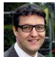
Dr. Christian Kienbacher Ambulatorium für Kinder- und Jugendpsychiatrie, Wien